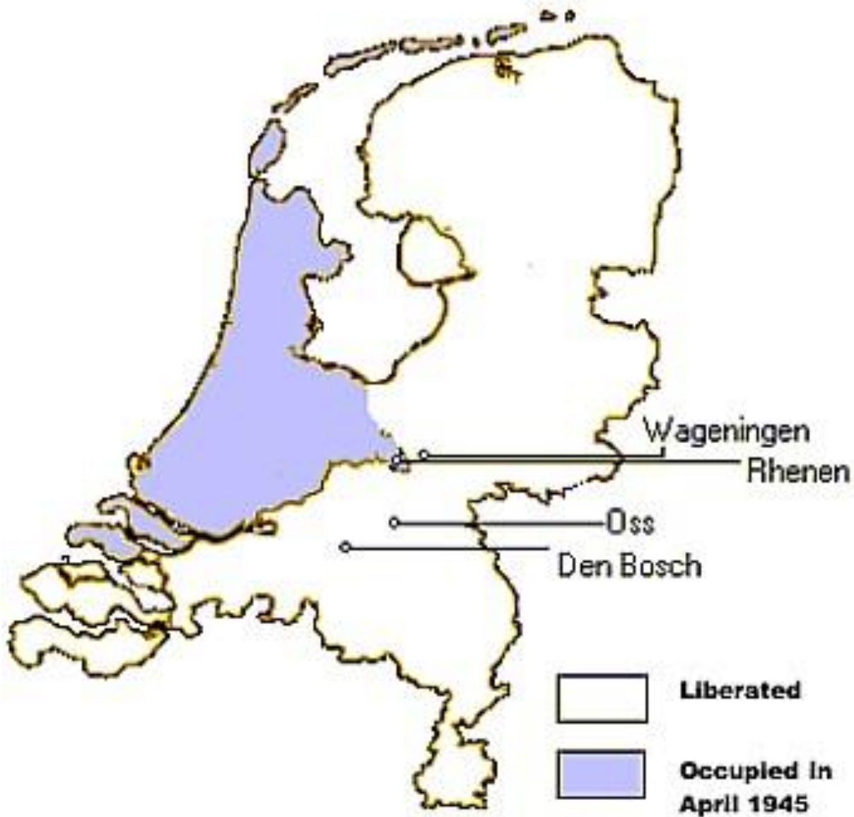
Map showing Netherlands liberated & occupied areas